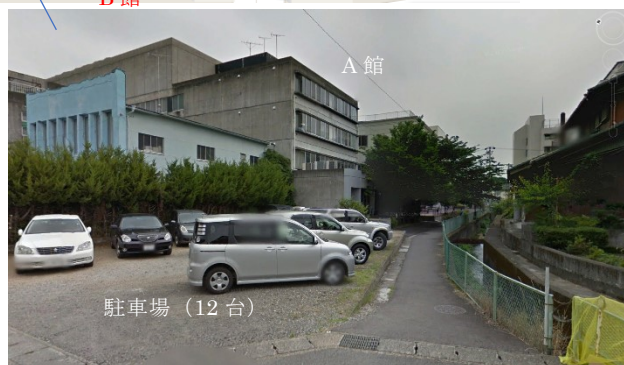
ビューポイント by google earth