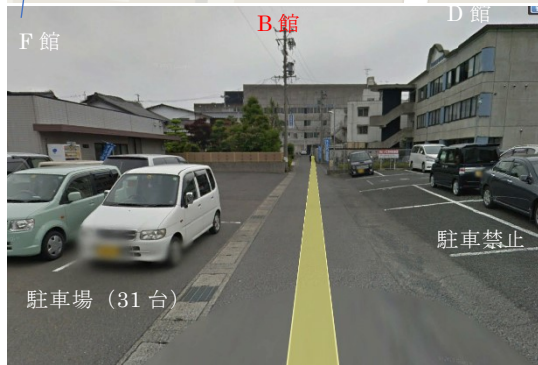
ビューポイント