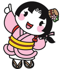
大垣市マスコットキャラクター おあむちゃん