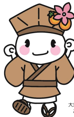
大垣市マスコットキャラクター おがっかい