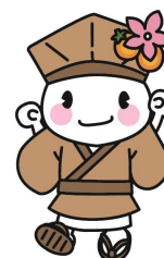
大垣市マスコットキャラクター おがっきい